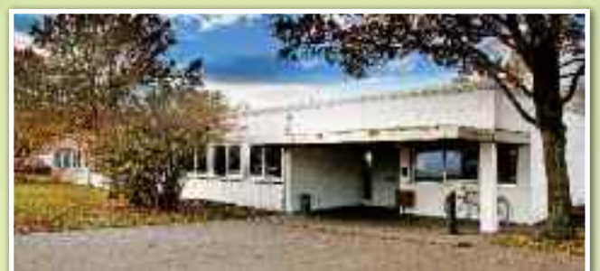
Freizeitheim Döhren: Das unzureichende gastronomische Angebot war einmal mehr Thema im Bezirksrat.

Einstimmig passierte daneben auch ein von den Sozialdemokraten formulierter interfraktioneller Antrag des Gremiums. Darin wird die Stadt Hannover gebeten, bei den für die Planung der S-Bahnstation Waldhausen zuständigen Akteuren Region, Land und Deutsche Bahn dafür Sorge zu tragen, dass der Bezirksrat Döhren-Wülfel von Anfang an über sämtliche Planungsschritte unaufgefordert unterrichtet und informiert wird. Denn obwohl bislang nur erste Vorüberlegungen existieren, sorgt das Vorhaben schon für Aufregung bei den Anliegern. Erster Ansprechpartner für die Bürger ist dann der Bezirksrat, der aber bislang in die Planungen nicht einbezogen wurde. JS